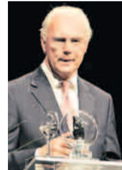
Fußball-Legende Franz Beckenbauer