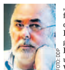
Promi-Coiffeur Udo Walz

Weil er so viel unterwegs ist, kennt er die Stadt wie seine Westentasche, hat jetzt ein neues Buch geschrieben „Mein Berlin“ (160 Seiten, viele Fotos, Knesebeck-Verlag, 19,95 Euro). Walz: