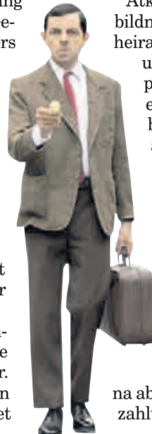
Kommt nach Berlin: Mr. Bean