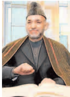
Hamid Karsai trägt sich ins Gästebuch ein