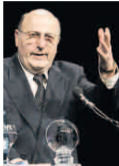
Manfred Krug mit seinem Award